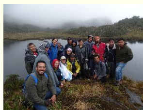
Intercambio de experiencias en el páramo Las Delicias

En septiembre pasado, se constituyó el Colectivo del Código de Ética por un grupo de académicos/as, personas líderes de pueblos indígenas, autoridades locales, miembros de organizaciones y movimientos sociales e indígenas. Durante septiembre y octubre, el colectivo participó en diversas actividades en el Departamento del Cauca, Colombia, como el IV CLAE y V CCE en Popayán, donde se compartieron experiencias con representantes de pueblos indígenas colombianos relacionados con la conservación de la diversidad biocultural y su gobernanza en México y Colombia; la asistencia al V Encuentro Internacional de Experiencias de Educación Popular en Popayán; la visita al Páramo Las Delicias, donde pobladores de Gabriel López están desarrollando una iniciativa de turismo rural en un paisaje biocultural sagrado de gran importancia para la recarga de acuíferos; un recorrido por comunidades indígenas Nasa en la zona de Tierradentro, con quienes se intercambiaron conocimientos sobre prácticas productivas, educativas y políticas desde la experiencia de un territorio miembro de la Coordinación Regional Indígena del Cauca (CRIC). Finalmente, se estableció una estrecha relación con la Universidad Autónoma Indígena Intercultural (UAIIN). Con la finalidad de concretar las acciones de aplicación del Código de Ética, se llevará a cabo un evento en febrero de 2016 en el Municipio de Tututepec, Oaxaca.