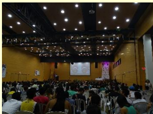
Ceremonia de apertura del IV CLAE y V CCE

Del 28 de septiembre al 2 de octubre se llevó a cabo en la ciudad de Popayán, Departamento del Cauca, Colombia, el IV Congreso Latinoamericano de Etnobiología (IV CLAE) y V Congreso Colombiano de Etnobiología (V CCE). Durante el evento, se contó con la participación de una gran cantidad de académicos/as de diferentes instituciones, médicos tradicionales, líderes de pueblos indígenas, asociaciones civiles y estudiantes, provenientes principalmente de distintos países de Latinoamérica. Durante el evento se llevaron a cabo tres conferencias magistrales, 29 simposios, 12 mesas de diálogos de saberes, el “Foro Internacional la Cultura del Jaguar”, el “Encuentro Etnobiológico Latinoamericano de Mujeres”, el encuentro audiovisual “Tejiendo redes bioculturales”, el conversatorio “Las comunidades tienen la palabra”, alrededor de 500 ponencias orales y cerca de 100 carteles. Fue un evento para fortalecer los lazos del quehacer etnobiológico en el continente americano!