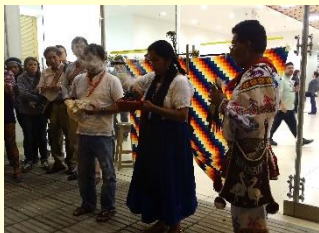
Ceremonia de agradecimiento al maíz