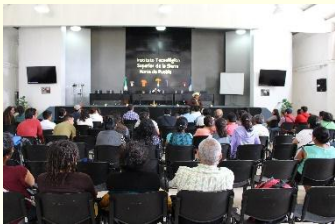
Actividades en el 1er Festival por la cultura de los Hongos Silvestres