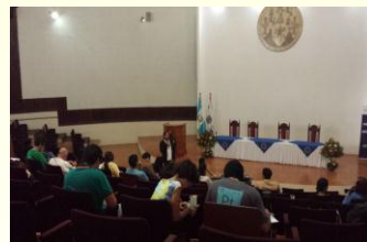
Universidad de San Carlos de Guatemala, IV Congreso Nacional de Biología