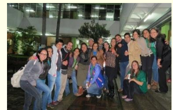
Universidad de Ciencias y Artes de Chiapas, XXX Semana de la Biología