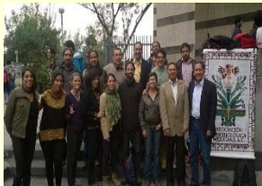
Actividades y asistentes a la Asamblea Ordinaria de la AEM 2015