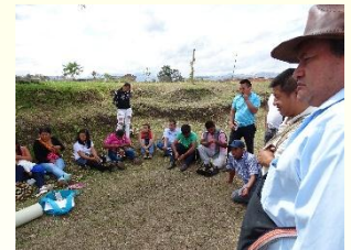
Universidad Autónoma Indígena Intercultural