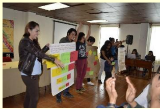
Actividades del 1 er Encuentro “El papel de las universidades en el conocimiento, protección y defensa del patrimonio biocultural”